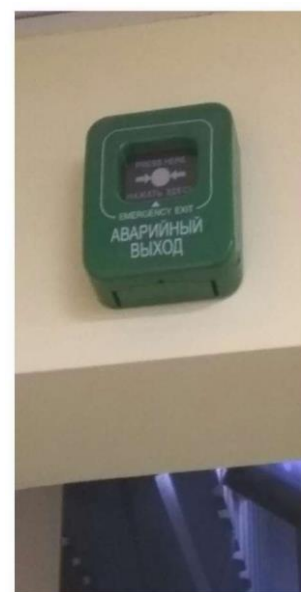
ИПР «АВАРИЙНЫЙ ВЫХОД».

Эвакуационные выходы могут быть оборудованы системой «Антипаника», что позволяет распахнуть дверь без использования ключа , либо двери оборудованы системой «СКУД» (система в автоматическом режиме разблокирует электромагнитные замки по сигналу пожарной сигнализации ). При пожаре, электромагнитные замки возможно разблокировать в аварийном режиме нажатием кнопки ИПР «АВАРИЙНЫЙ ВЫХОД» .