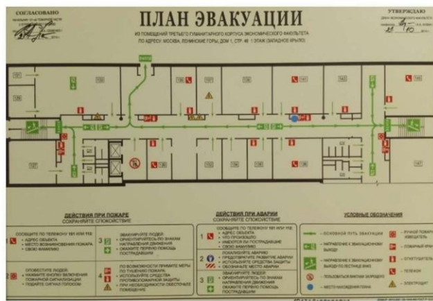
План эвакуации из помещений экономического факультета по адресу, Москва, Ленинские горы, дом 1, стр. 46, 1 этаж (западное крыло)